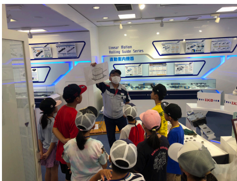
従業員の家族を対象とした会社見学会