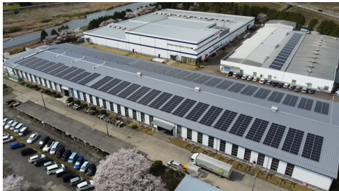
岐阜製作所（武芸川地区）で導入したオンサイトPPA