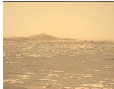
NASA の火星探査機パーサヴィアランスの左側のマスカム-Zカメラで撮影された画像