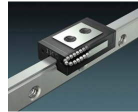
IKO リニアウェイ L

マスカム-Z (Z はズームの頭文字) は着陸後、地球に素晴らしい画像を送り続けており、我々が興味を持って見るためだけでなく、技術者が探査機を操縦したり、科学者が研究に値する岩石を見つけるために、重要なデータの提供も同時に行っています。