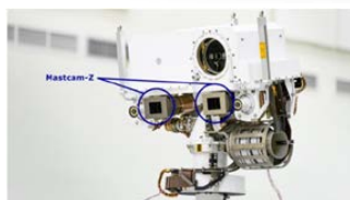
マスカム-Zカメラ拡大図

パーサヴィアランス に関して (英文) : https://mars.nasa.gov/mars2020/