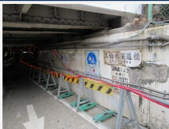
高輪橋架道橋(行燈殺し・首曲がりトンネル)

5月末に菅首相も視察を行っている、一部保存が進められている高輪架道橋。150年前の遺構ということで、確かに日本史の授業で見た明治時代の鉄道の絵とそっくり。当社が隣接するのは第2街区という地域で、出土状況が良く40mほどを新設の公園と隣接して保存するとか。